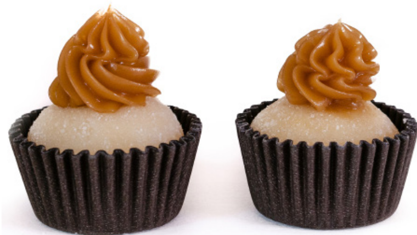
22. Branquinho com Doce de Leite R$ 2,00