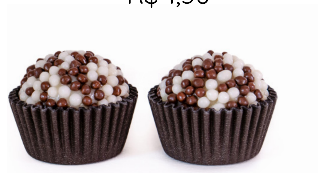
16. Branquinho com Crispies R$ 1,50