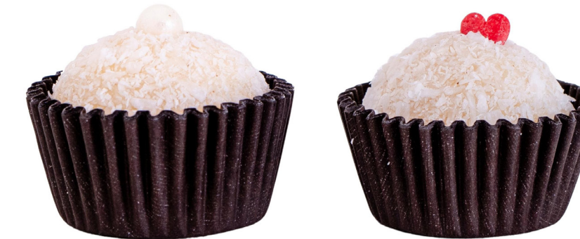
28. Beijinho com Pérola ou Coração R$ 1,50