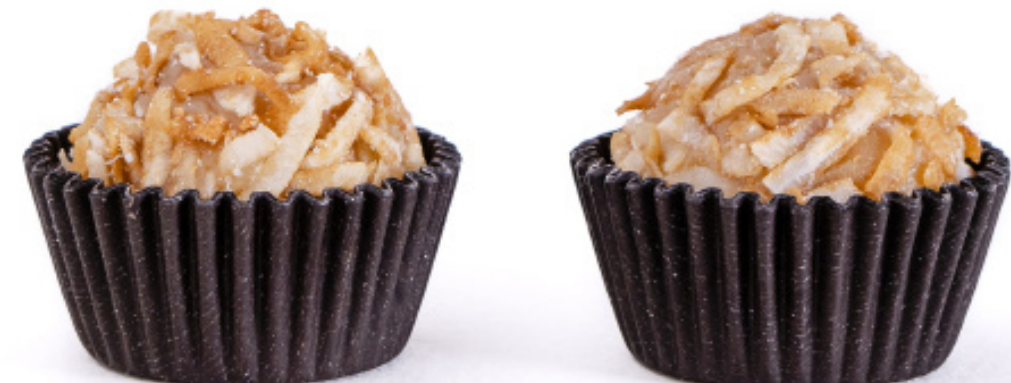
27.Beijinho com Coco Queimado R$ 2,00