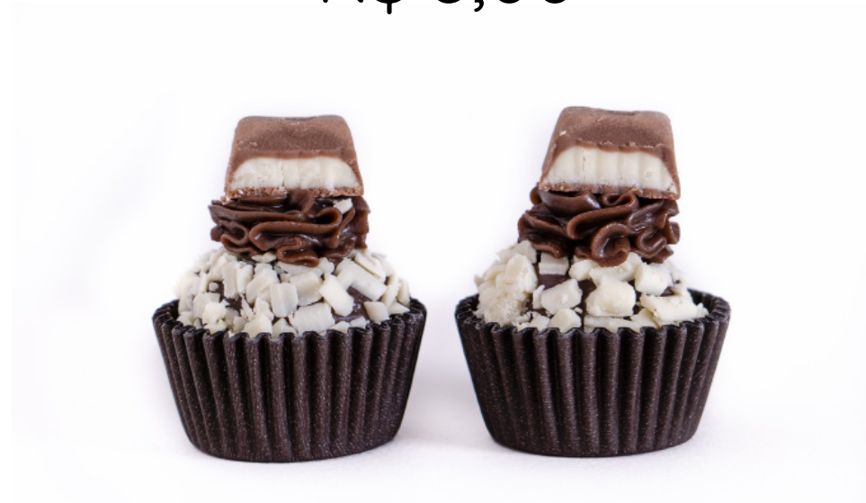
07. Brigadeiro com Trufa de Chocolate e Kinder Barrinha R$ 3,00