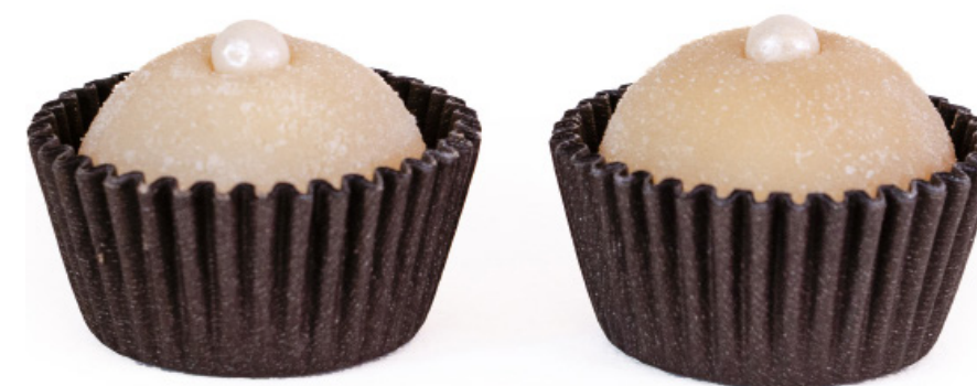
17. Branquinho no Açúcar com Pérola R$ 1,50