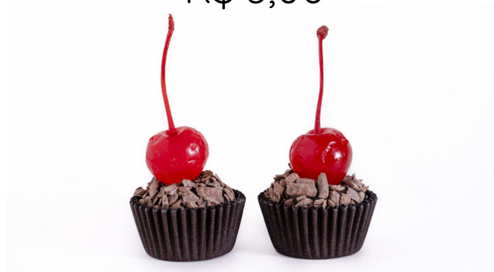
10. Brigadeiro Floresta Negra R$ 3,00