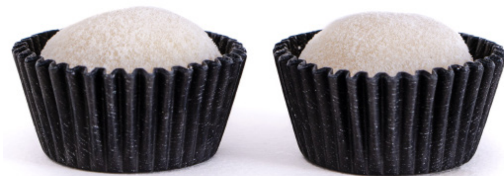
32.Ninho R$ 1,50