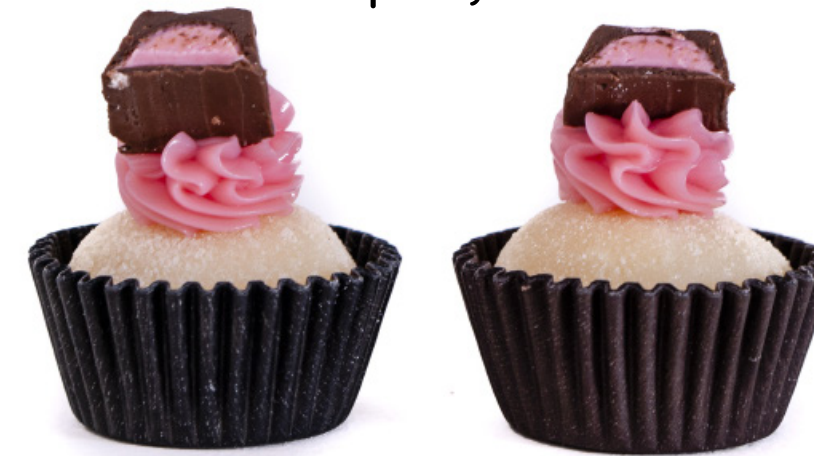
21. Branquinho com Doce de Morango Cremoso e Stikadinho R$ 2,50