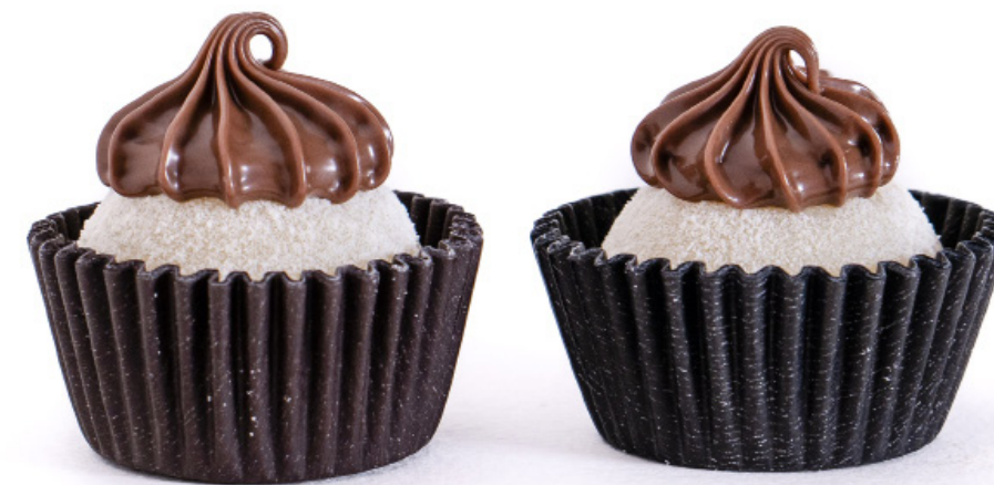
33.Ninho com Nutella R$ 2,00