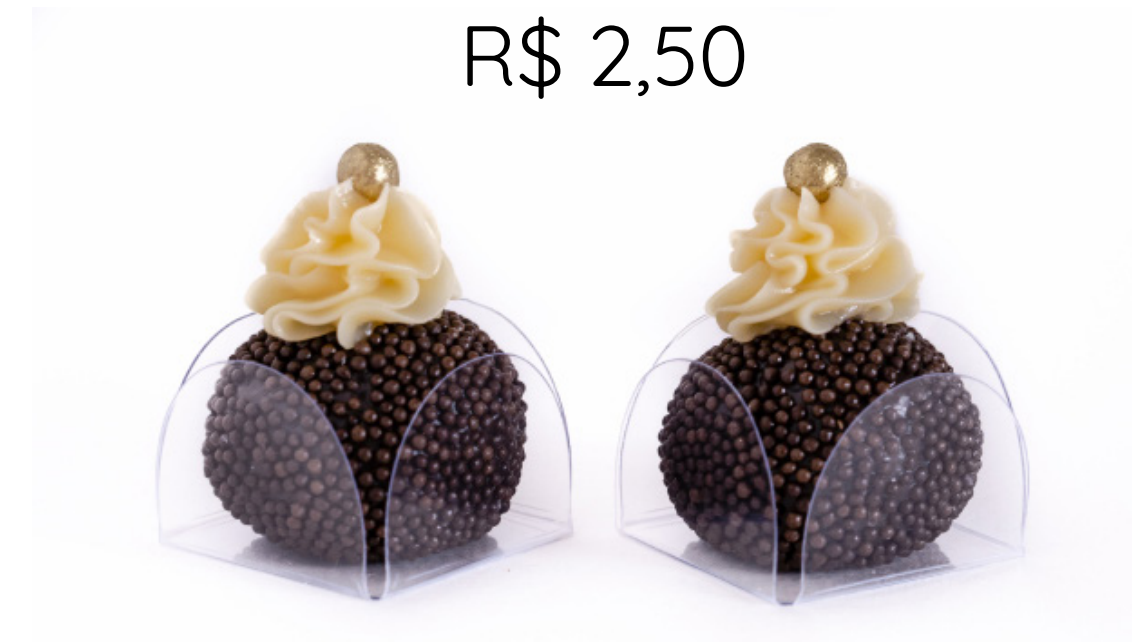
09. Brigadeiro com Trufa de Chocolate Branco R$ 2,50