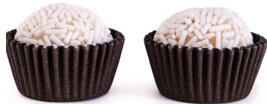
13. Branquinho com Granulado Branco R$ 1,50