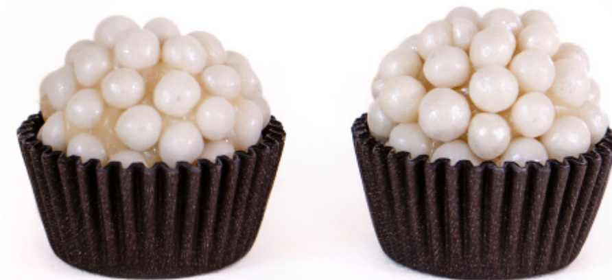
20. Branquinho com Pérolas R$ 2,50