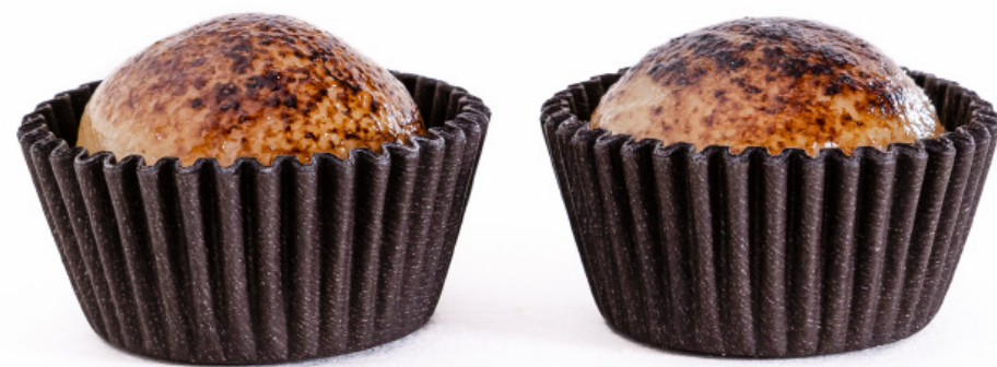
19. Branquinho Brullé R$ 2,00