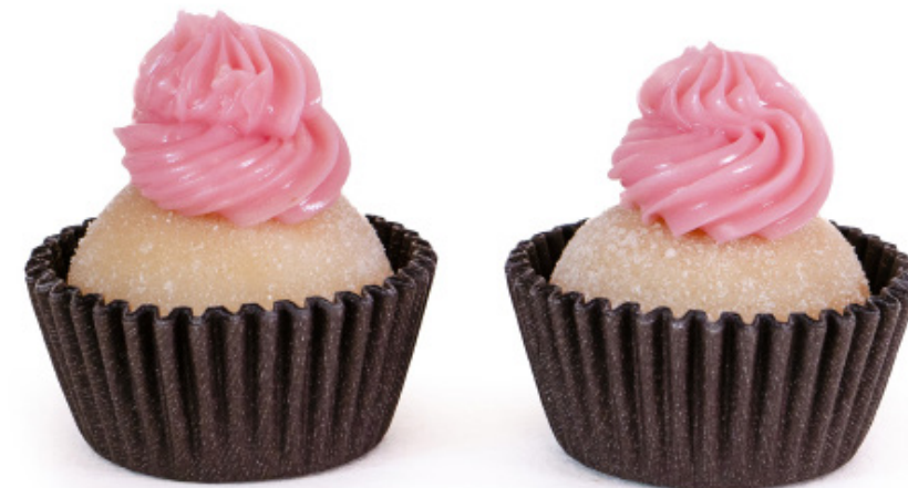
23. Branquinho com Doce de Morango Cremoso R$ 2,00