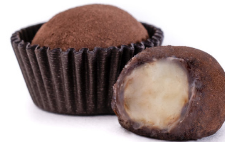
34.Brigadeiro de Nutella com recheio de Leite Ninho R$ 2,50