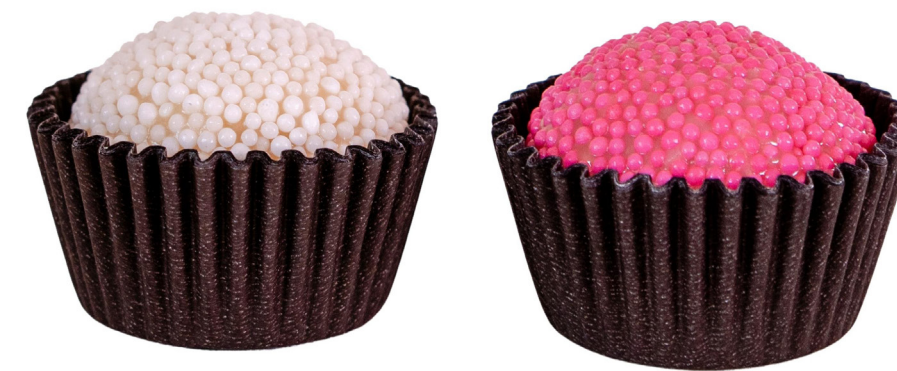
14. Branquinho com Miçanga R$ 1,50