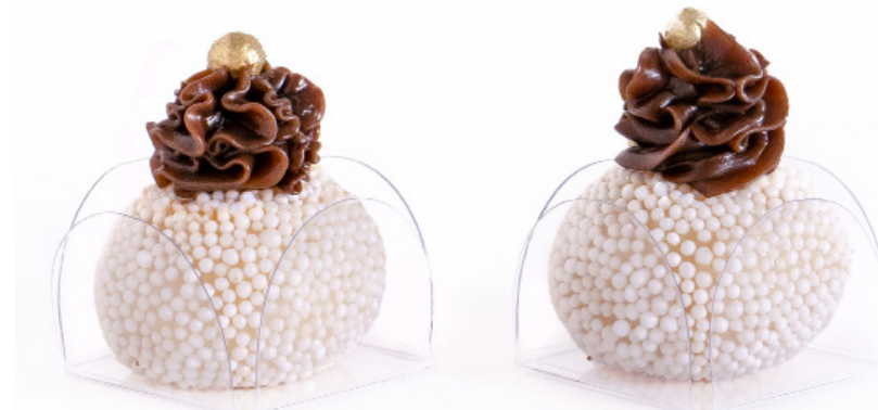
24. Branquinho com Trufa de Chocolate Preto R$ 2,50