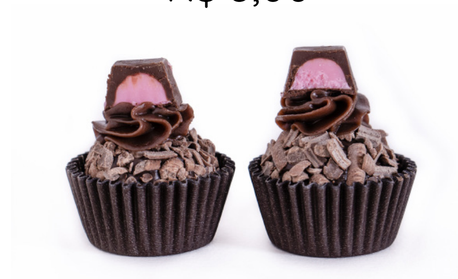
08. Brigadeiro com Trufa de Chocolate e Sktikadinho R$ 3,00