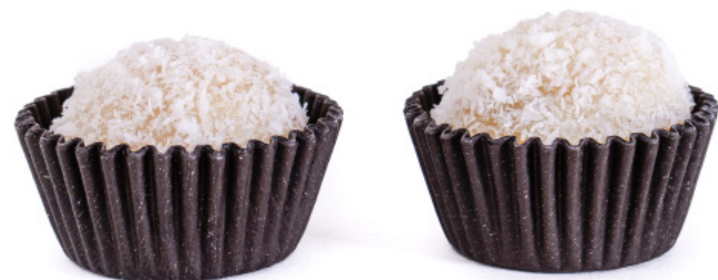
30.Abacaxi com Coco R$ 2,00