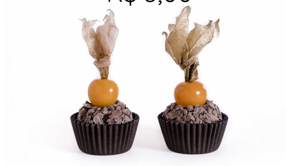
11. Brigadeiro com Physalis R$ 3,00