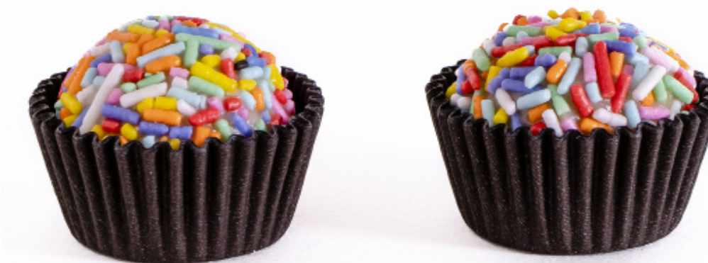
15. Branquinho com Granulado Colorido R$ 1,50