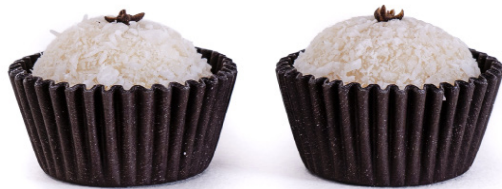
26.Beijinho com Cravo R$ 1,50