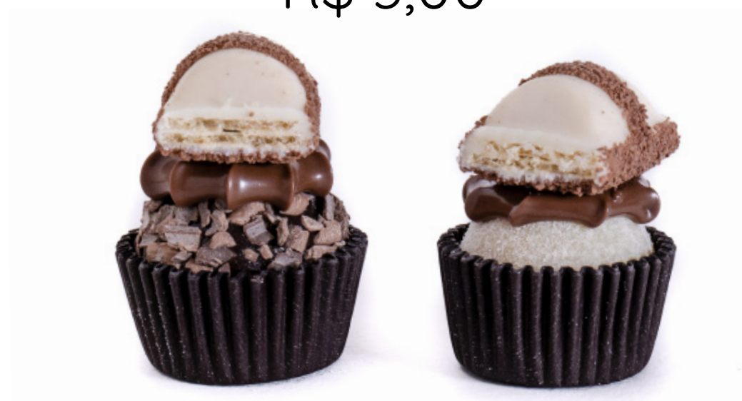
36.Ninho ou brigadeiro com Nutella e Kinder Bueno R$ 3,00