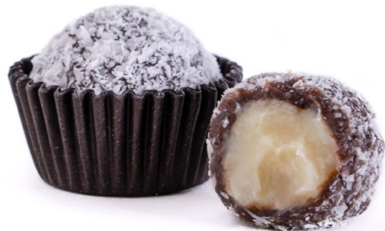
29.Prestígio R$ 2,50