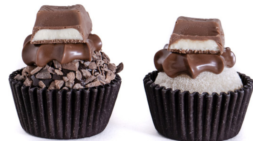
35.Ninho ou Brigadeiro com Nutella e Kinder Barrinha R$ 2,50